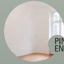
PINTURAS EN GENERAL