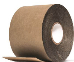
TYPAR® CINTA FLEXIBLE Rollo de 15.24 cm x 22.8 ml

La cinta para construcción Typar® permite pegar rápidamente los solapes de las barreras con iguales condiciones de resistencia a los rayos UV y climas extremos que las propias barreras.