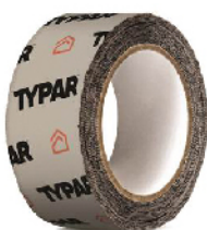
TYPAR® CINTA DE CONSTRUCCION Rollo de 4.76 cm x 50.3 ml