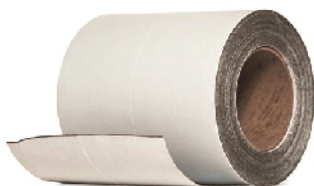
TYPAR® CINTA REGULAR Rollo de 15.24 cm x 22.8 ml